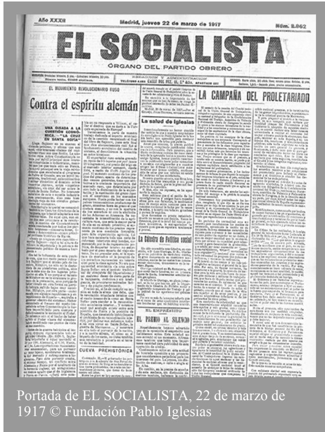
Portada de EL SOCIALISTA, 22 de marzo de 1917