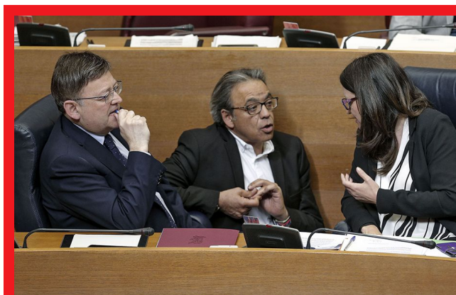
Ximo Puig (i), junto a Mónica Oltra, y el portavoz del grupo socialista, Manuel Mata (c)

Los socialistas valencianos defenderán en el próximo pleno la necesidad de convocar "de manera urgente o con la mayor brevedad posible" la comisión de seguimiento entre la Generalitat y el Ministerio de Fomento para reivindicar "la necesidad de poner en marcha ya el conocido como 'tren de la costa' atendiendo a razones económicas, sociales y de vertebración del territorio, pese a la negativa del Gobierno de Rajoy de apostar por