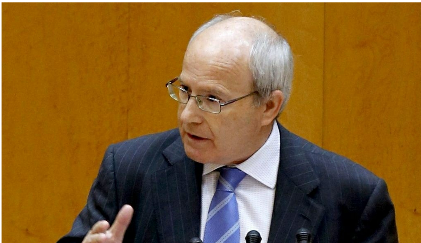
El senador socialista catalán José Montilla

MADRID / El senador socialista catalán, José Montilla, pidió ayer tarde al Ministro de Cultura, Iñigo Méndez de Vigo, que deje de dar la espalda a las instituciones culturales catalanas, revise el marco de colaboración, defina un calendario para reequilibrar su financiación e implique más al Gobierno y al Ministerio de Cultura.